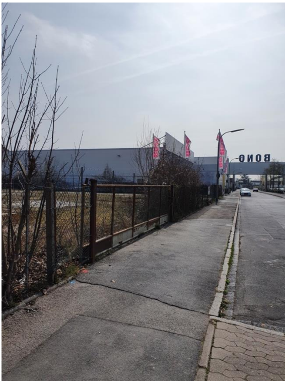
Abb. 2: Betreffender Gehweg, aus Richtung Klosterpark kommend