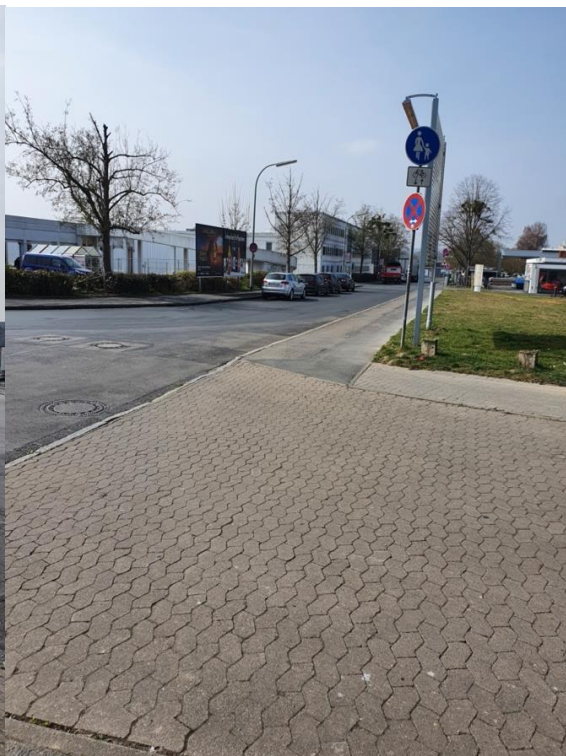
Abb. 3: Nördlicher Wagenstiege, Gehwegnutzung durch Radverkehr erlaubt (Blick vom südl. Ausgang Klosterpark)