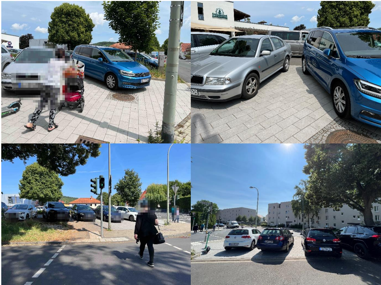
Die für Fußgänger*innen vorgehaltenen Flächen sind häufig und insbesondere bei Badewetter zugeparkt.