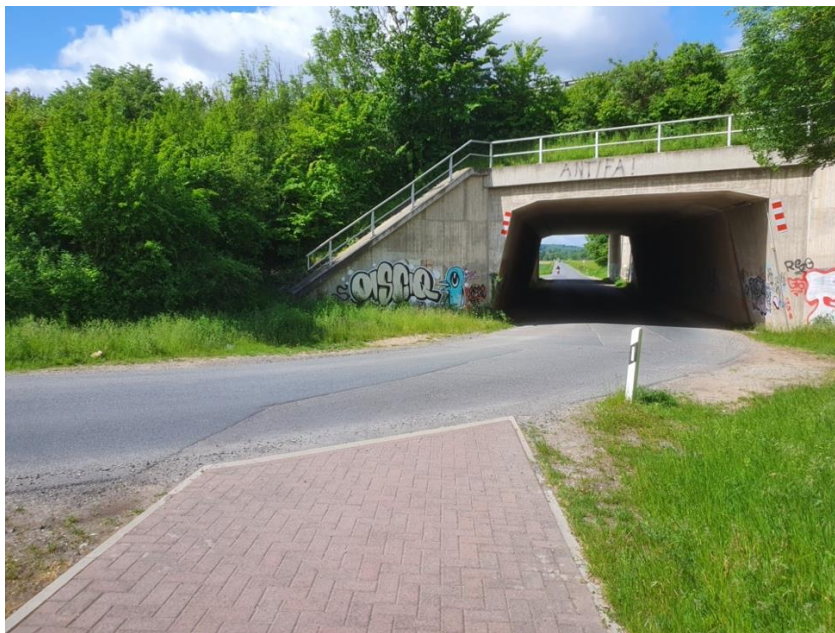
Blick auf die Unterführungen Am Dragoneranger von Süden kommend. Hier wäre eine Aufleitung des Radverkehrs auf die Straße wünschenswert.